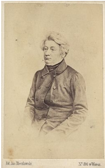
Adam Mickiewicz

Adam Mickiewicz (1798–1855) – jeden z najwybitniejszych poetów romantyzmu. Urodził się w Zaosiu lub Nowogródku na Litwie. Kresowe pochodzenie stworzyło podstawy dla jego oryginalnej wyobraźni poetyckiej. Od najmłodszych lat poeta poznawał baśnie oraz podania ludu litewskiego, białoruskiego i polskiego. Znalazło to odbicie w jego wczesnych tekstach. W 1822 roku opublikował Ballady i romanse – nowatorski zbiór, który uważa się za przełom rozpoczynający romantyzm krajowy. Poeta jest także autorem licznych liryków (m.in. cyklu Sonetów krymskich ), powieści poetyckich (m.in. Grażyna , Konrad Wallenrod ), wybitnego dramatu romantycznego Dziady oraz narodowej epopei Pan Tadeusz .