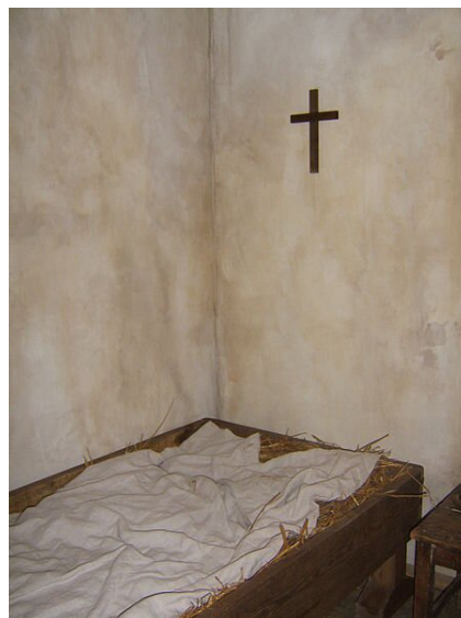
Wilno. Cela Konrada. Współczesna ekspozycja muzealna Farary, domena publiczna

Moralitet wywodzi się z misterium. Charakteryzują go wyraźny podział świata wartości na dobro i zło oraz dominujący morał. Na wzór średniowiecznych misteriów w III cz. Dziadów występuje podział sceny na prawą (dobro) i lewą (zło). Przestrzeń życia wewnętrznego bohatera nakłada się na sens wypadków dziejowych w dramacie, który nie ma jednoznacznego zakończenia (dramat formy otwartej), natomiast odbiorcy dowolnie interpretują ukryte sensy filozoficzne, ideowe, sceny symboliczne. Mimo że mesjanistyczne akcenty dotyczą głównie motywów pasyjnych, w scenie więziennej zwraca uwagę ciekawie skomponowany motyw stylizowany na kantyczkę bożonarodzeniową.