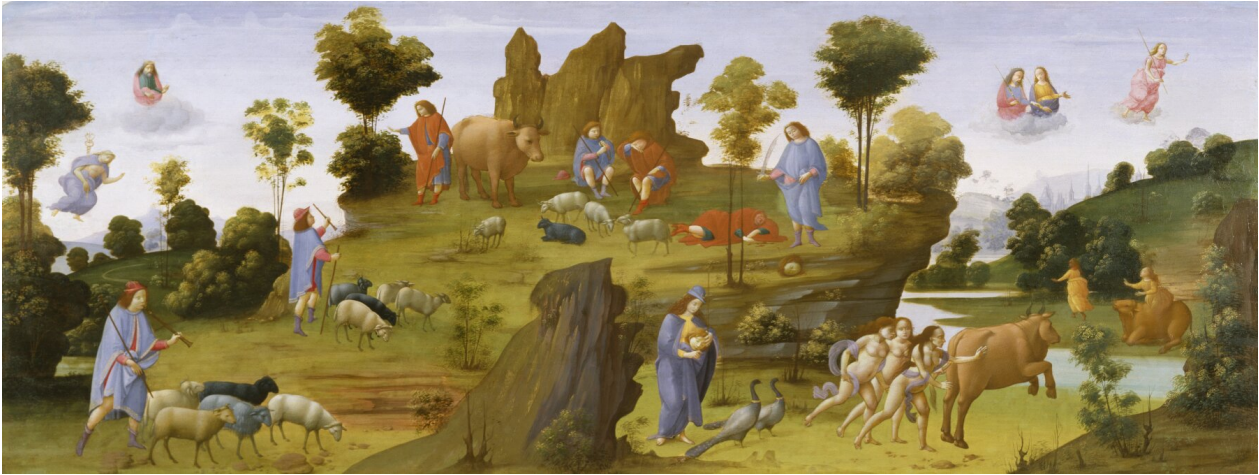
Mit o Io

Bartolomeo di Giovanni, Mit o Io, ok. 1490, Walters Art Museum, USA, domena publiczna