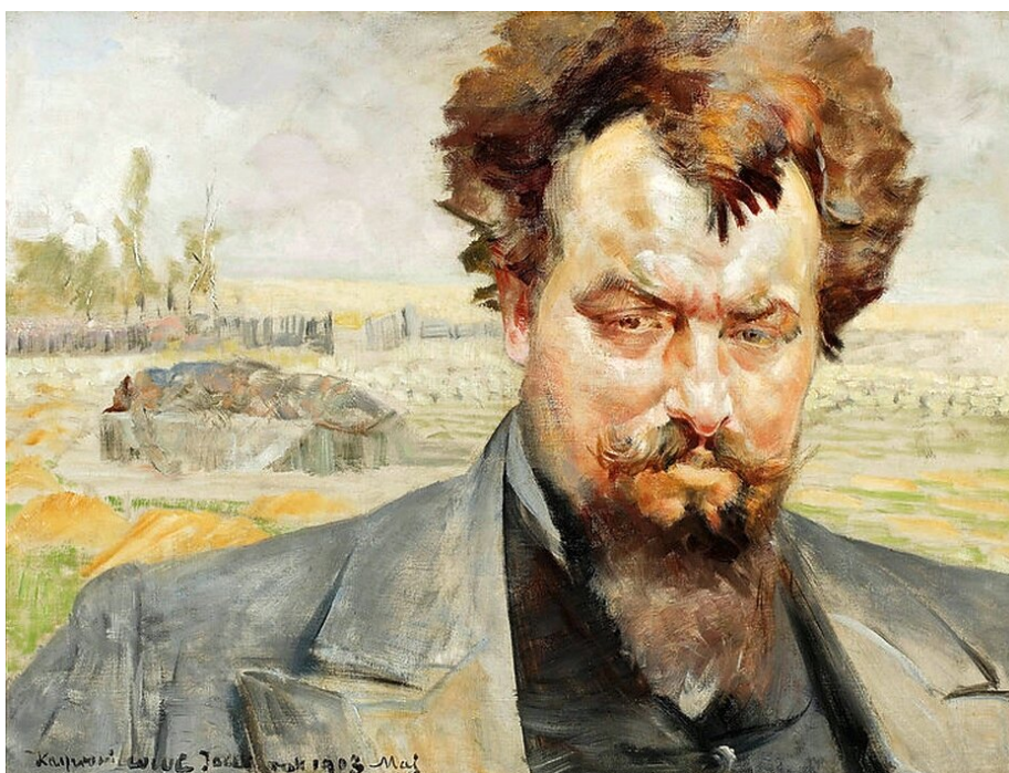
Jacek Malczewski, Portret Jana Kasprówicza, 1903

Napisz rozprawkę problemową na temat: „Wieś – spokojna czy kraina pełna cierpienia?”. Rozważ problem i uzasadnij swoje zdanie, odwołując się do wybranych fragmentów tekstów prozatorskich z różnych epok, a także do innych tekstów kultury (np. do filmów lub obrazów).